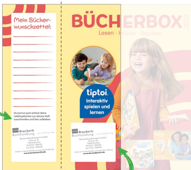
Beispiel Umhelter Rückseite