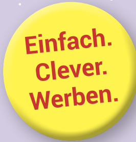
fotografische Titelvariante 2019

Titelseite 1 (fotografisch) Titelseite 2 (illustrativ)