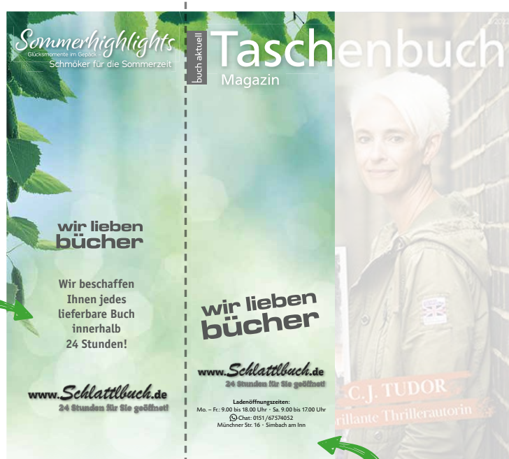
Beispiel Umhefter Rückseite

je 50 Ex. nur 39,50 €* (= 118,50 € im Jahr)